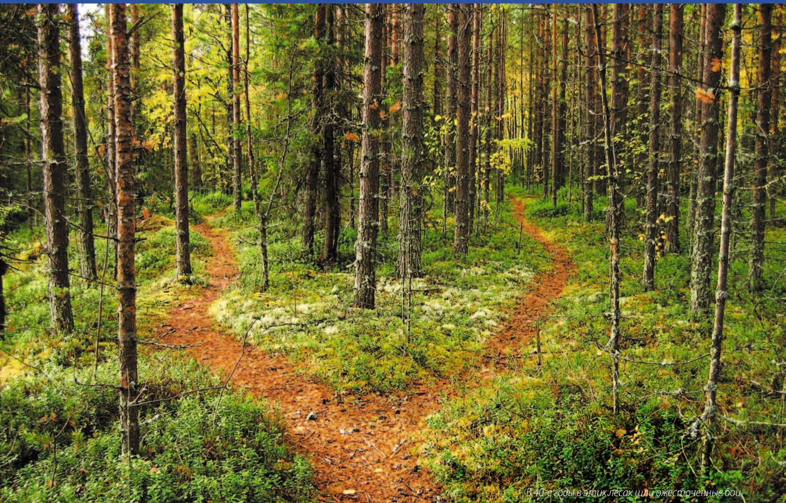
В 40-е годы в этих лесах шли ожесточенные бои